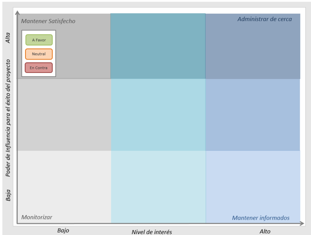
Figura 1: Modelo de Mapa para el Análisis de los Actores Identificados

Se recomienda revisar ambos elementos de manera continua a lo largo del proyecto, ya que las posturas y nivel de influencia de los actores claves no son elementos estáticos. La frecuencia para estas revisiones debe ser determinada en base de las características específicas del proyecto, y en especial los niveles de interés de los actores identificados.